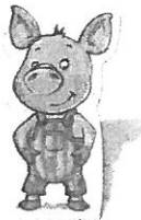
Illustration: Oliver Freudenreich Redaktion: Monika Gohl

Ein Leiter- und ein Sammelspiel für 2–4 Spieler von 3–7 Jahren.