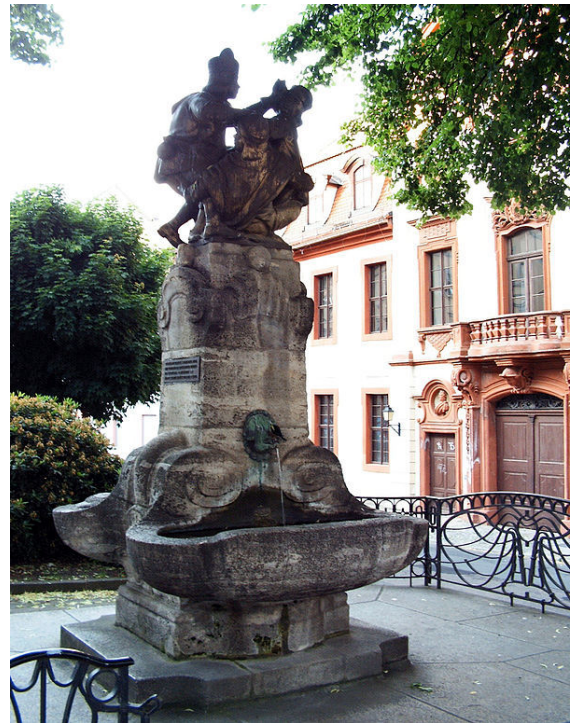
Der Skatbrunnen mit den „Vier Wenzeln“ in Altenburg

Skat wurde ab 1810 aus dem älteren Kartenspiel