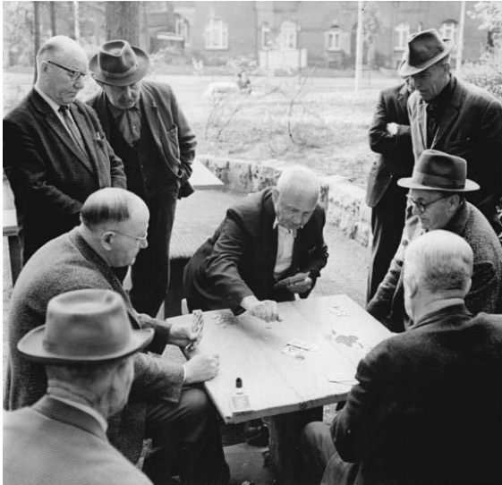
Skatspieler in einem Park in Erfurt (1967)