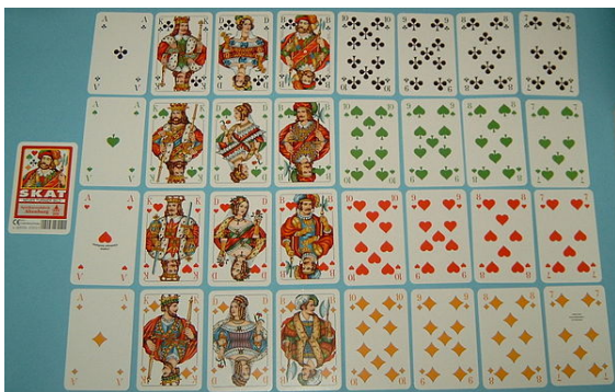
Skatblatt, französisches Bild mit deutschen Farben (Turnierbild)

Skat ist ein Kartenspiel für drei (spielende) Personen. Aktiv spielt ein Alleinspieler gegen beide Mitspieler (die Gegenpartei). Nach dem Ausgeben der Karten wird durch das sogenannte Reizen bestimmt, welcher Spieler zum Alleinspieler wird. Sobald das Spiel beendet ist, wird anhand der Kartenwerte ausgezählt, ob der Alleinspieler (61 Punkte) oder die Gegenpartei gewonnen hat. Die Punkte werden notiert, und man geht zum nächsten Spiel über.