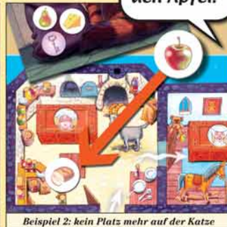
Beispiel 2: kein Platz mehr auf der Katze