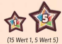
(15 Wert 1, 5 Wert 5)