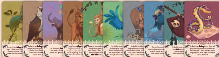
Vorderseite mit Kurzbeschreibung der besonderen Fähigkeit des Tiers