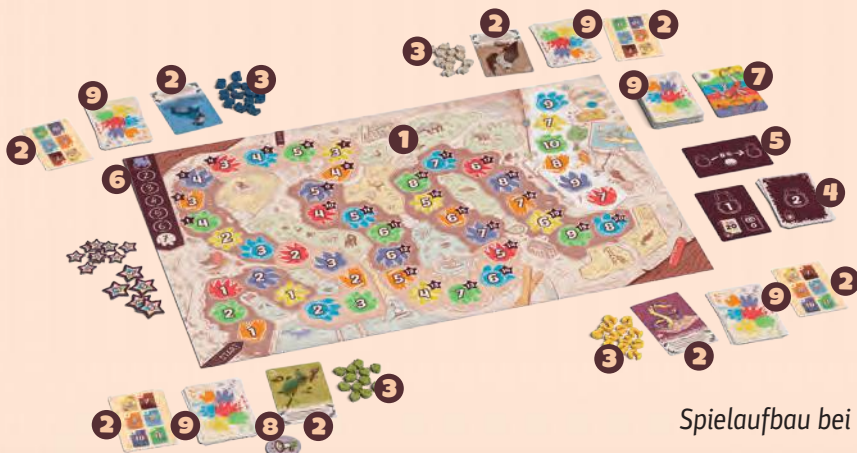
Spielaufbau bei 4 Personen

Hinweis: Je nach Anzahl der mitspielenden Personen kann es vorkommen, dass manche Personen 1 Karte mehr bekommen. Dies ist nicht weiter schlimm.